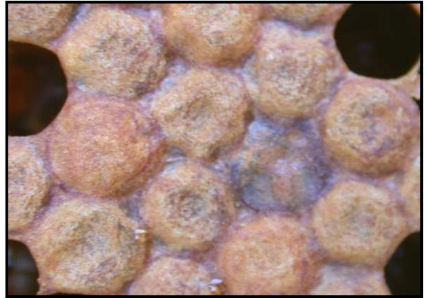
Opérculos oscuros y hundidos