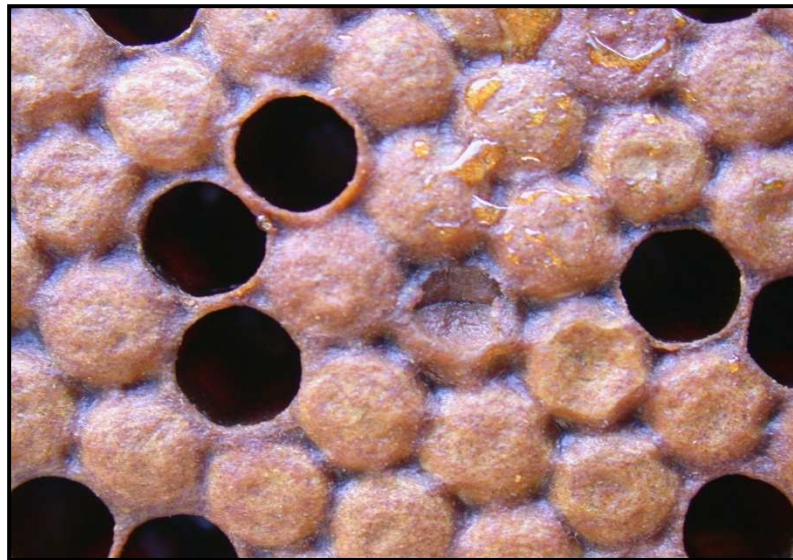
Opérculos oscuros y hundidos

Este impreso de enfermedad ha sido diseñado para reconocer los signos clínicos de la enfermedad en las colonias de abejas.