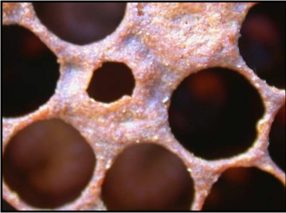
Agujeros en los opérculos