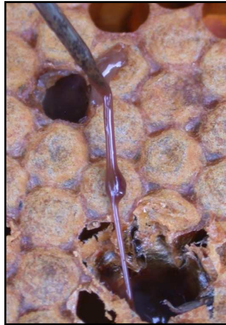
Prueba del palillo, larva viscosa

Este impreso de enfermedad ha sido diseñado para reconocer los signos clínicos de la enfermedad en las colonias de abejas.