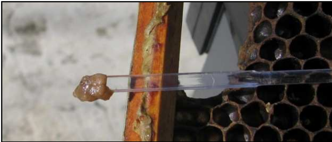
Larva de color marrón

Este impreso de enfermedad ha sido diseñado para reconocer los signos clínicos de la enfermedad en las colonias de abejas