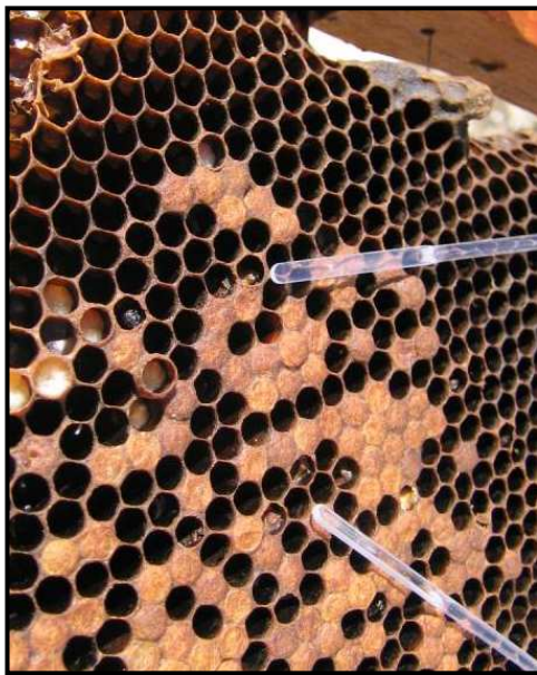
Larva desprendida en celdillas no operculadas