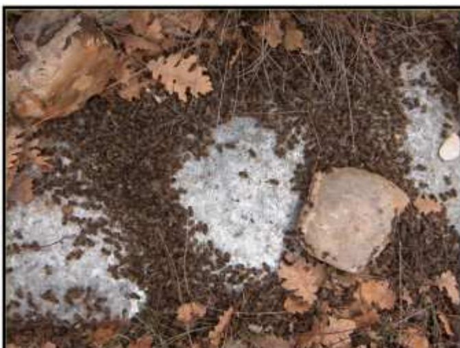
Presencia de abejas muertas delante de la colmena