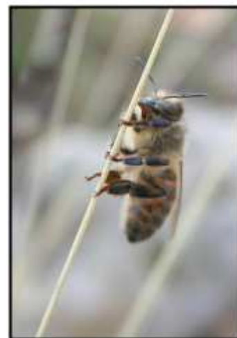
Abeja subiendo por la hierba

Este impreso de enfermedad ha sido diseñado para reconocer los signos clínicos de la enfermedad en las colonias de abejas